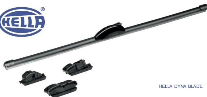
HELLA DYNA BLADE

ELIT Киев-1 ул. Червонопрапорная, 135 тел.: (044) 389-44-44