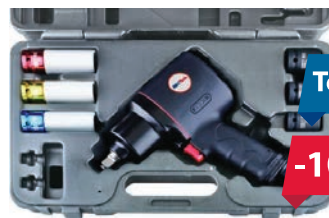
XT TOOLS 43-4002