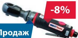
XT TOOLS 34-3023