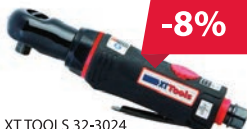
XT TOOLS 32-3024